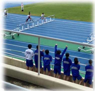
【競技を応援している様子】

朝練中心の臨時部活動である本校の陸上部ですが、常設の陸上部を有する他校に引けを取らず、堂々と渡り合っていました。生徒たちが、自己ベストを目指して精一杯競技する姿は、とてもすばらしかったです。毎日、朝早くから学校へ送り出していただいた保護者の皆様のご理解とご協力に感謝申し上げます。