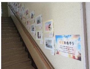
【階段に並んだ生徒作品】