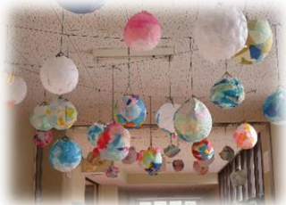
【階段に並んだ生徒作品】