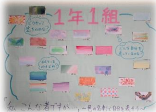
【生徒会のメッセージ】