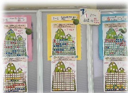
【クラス対抗『読書登山』】

図書館では、皆さんにたくさん本と接する機会を増やすために、様々なイベントを開催してあります。「クラス対抗『読書登山』」もその一つです。