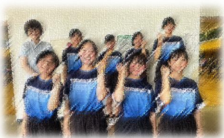
【女子卓球部 喜びの表情】